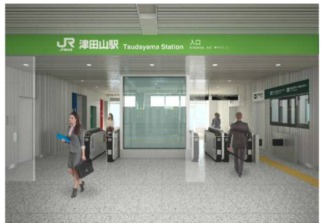
改札入口イメージ