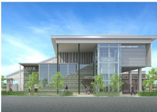
北口外観イメージ