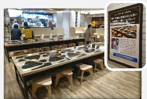
(株)丸井 マルイファミリー溝口 HARA8