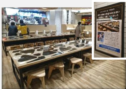
マルイファミリー溝口（フードコート）