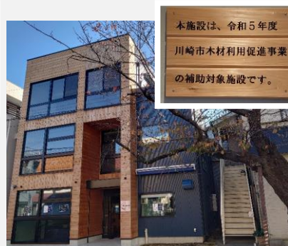
楽市楽座（店舗・地域交流カフェ）