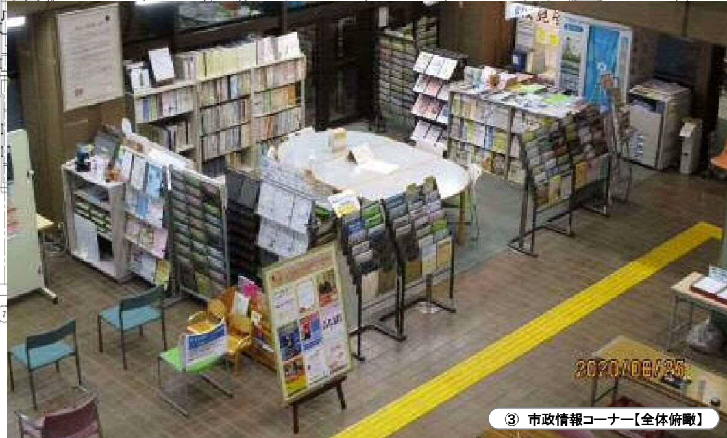
③ 市政情報コーナー【全体俯瞰】