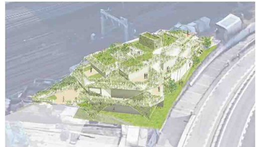
(イメージパース) ※今後の検討により変更となる場合があります。