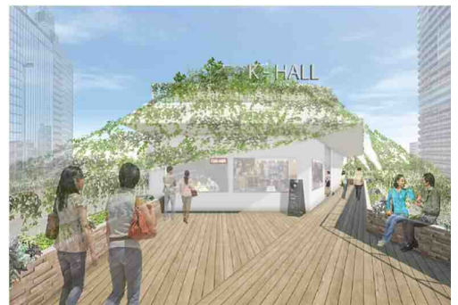
(イベント利用イメージ)