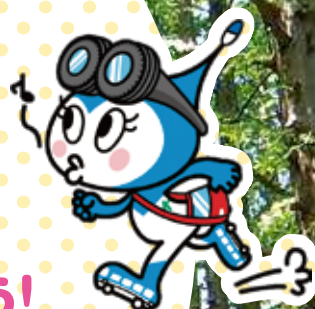
かわさき ルフィン