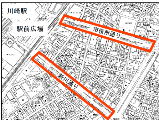
拡大実施する主な場所