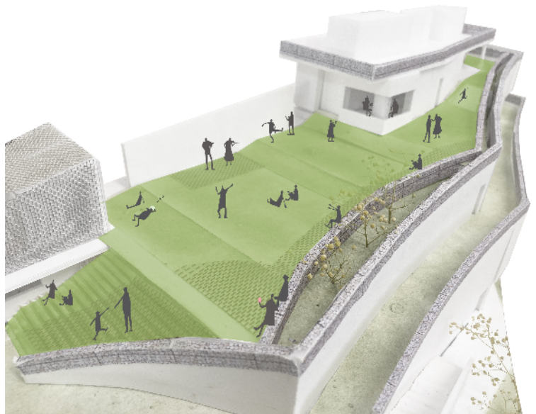
屋上広場のイメージ