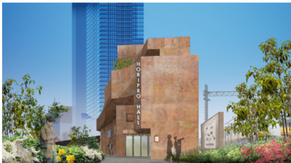
エントランスから見たイメージ

※パースは現時点での計画を反映したものです。竣工までに一部変更になる可能性があります。施設名称は仮のものです。