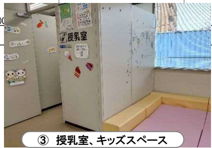
③ 授乳室、キッズスペース