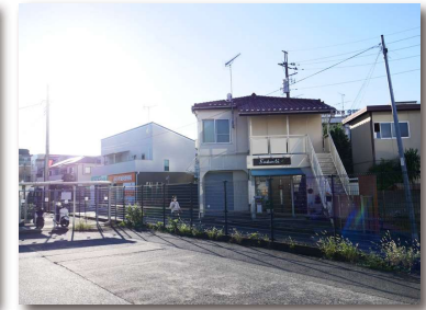
= 遊園地まで夢を乗せて走っていた豆電車・モノレール