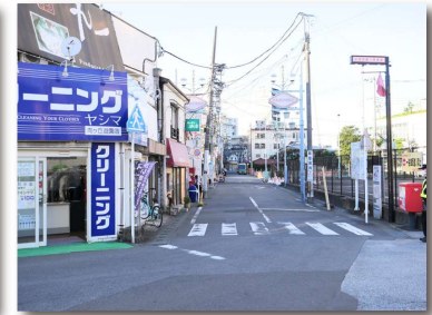
= 駅前にあった映画館「登戸銀映劇場」