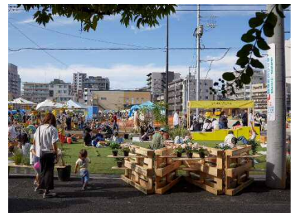
（左）「登戸・遊園 ミライノバ ハレの日」ロゴ （中央・右）昨年の「ハレの日」の様子（来場者7,000人程度）