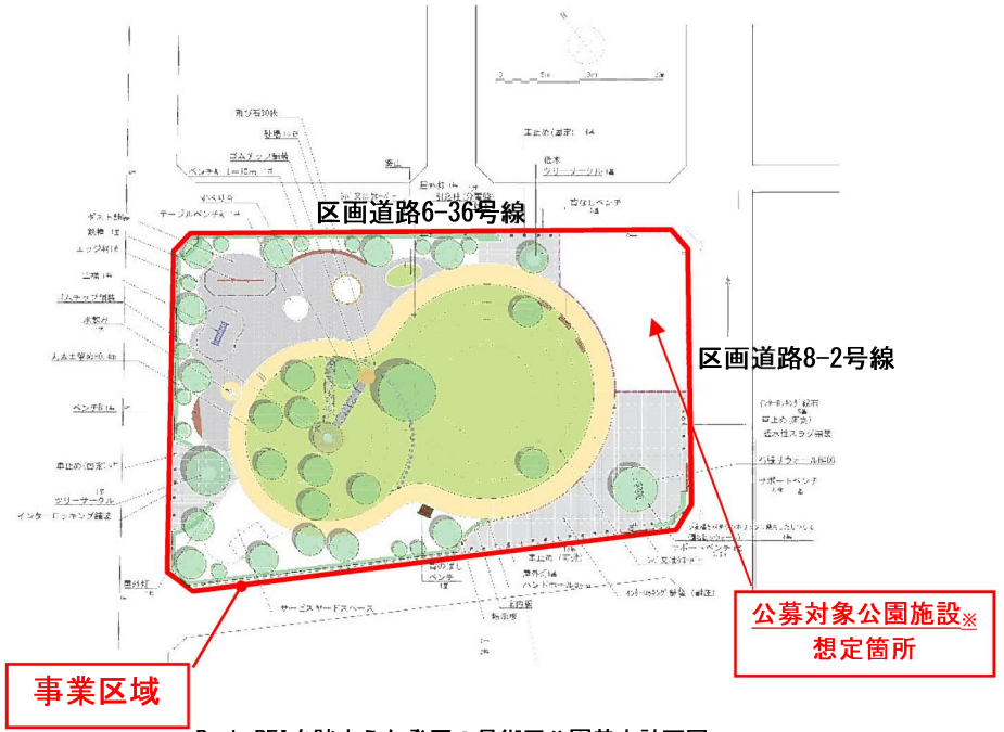
Park-PFIを踏まえた登戸2号街区公園基本計画図