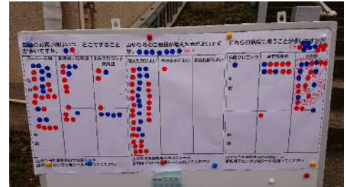
図6 山ゆり祭の様子 (上：セレスアモスによる朝市、中：地域包括支援センターによる健康体操、下：シール投票による意見収集)