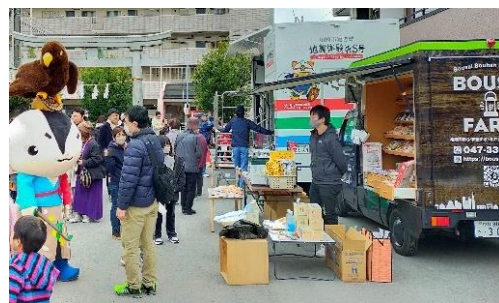
▲ 防災交流イベント取組例