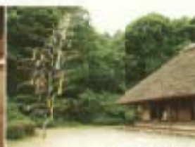
舟中行事(七夕祭り)