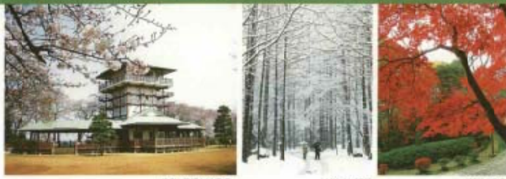
緑山展望台(4月頃) メタセコイア林 紅葉(11月頃)

多摩区緑のゆるやかな丘陵に広がる生田緑地は約40ヘクタールにわたる緑の宝庫です。エタ湖に特色ある山頂展望台、しょうぶ園、噴水、青少年科学館、岡本太郎美術館、日本民家園、伝統工芸館、ゴルフ場があります。また、秋には「はらまつり」も開催しています。