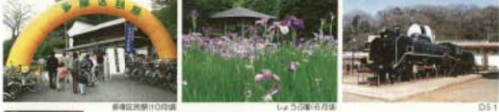
多摩区民祭(10月頃) しょうぶ園(6月頃) D51