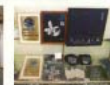
夏場のグッズ販売