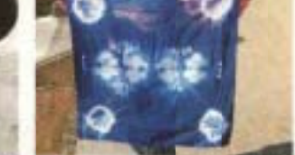
販売中のハンカチ