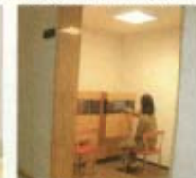
情報コーナー(ブースコーナー)