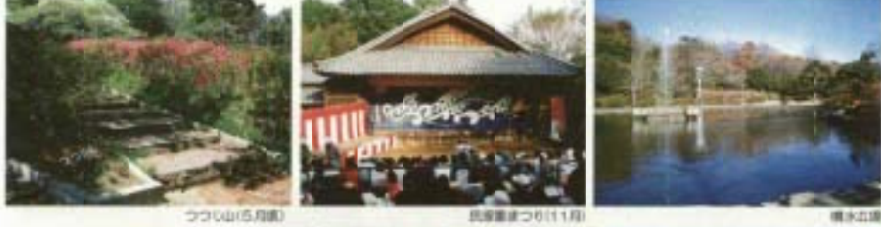
つくり山(5月頃) 長原まつり(11月) 噴水公園