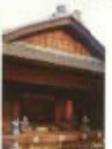
民家園まつり(舞台公演)