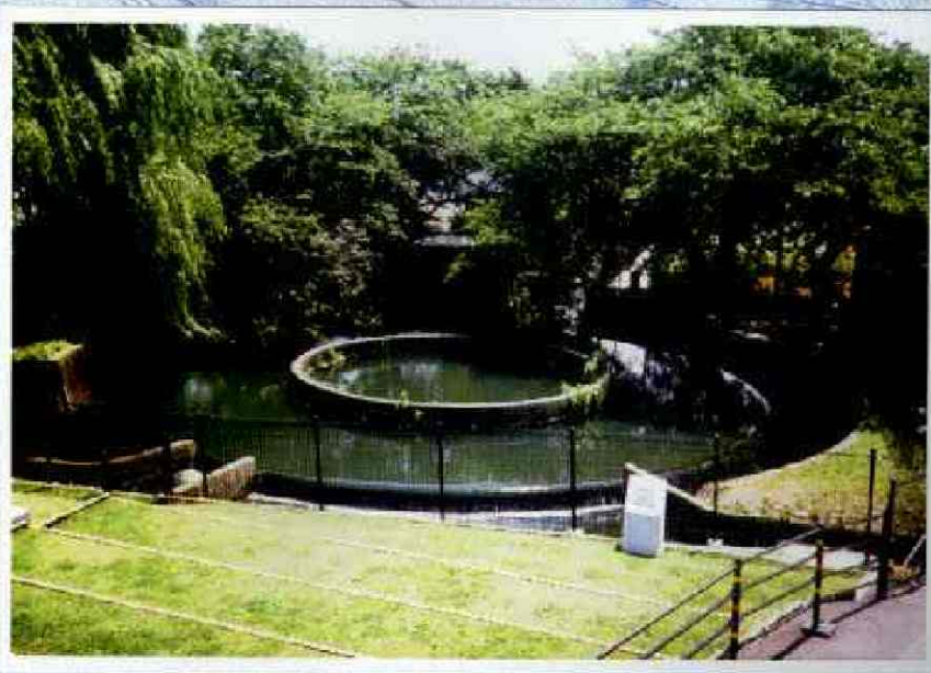
川崎市二ヶ領用水・円筒分水

21世紀において、真に豊かな市民生活が実感できる、安全で快適な都市づくりには、都市景観の構成要素としての水辺の保全や、人々が憩う舞台としての水辺の再生を図っていかなければなりません。