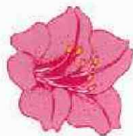
市民の花 つつじ Azalea : City's symbol flower