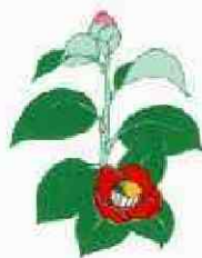
市民の木 つばき Gamella : City's symbol tree