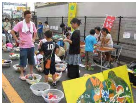
地元イベント、商店街への協力

「登戸東通商店会 昭和レトロな町並みデザイン集作成」への参加。民家園通り夏まつりなど。