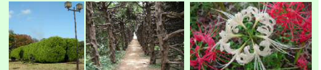
カイツカイビキのトンネル ヒガンバナ(9月)