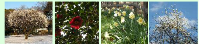
白梅(1月) ツバキ(2月) スイセン(2月) ハクモクレン(2月)