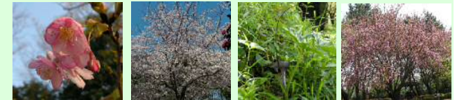
カワヅザクラ(3月) ソメイヨシノ(3月) ウラシマソウ(4月) ヤエザクラ(4月)