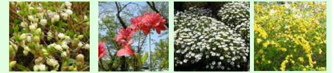
ドウダンツツジ(4月) オオムラサキ(4月) マーガレット(5月) ヤマブキ(5月)