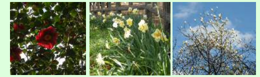
ツバキ(2月) スイセン(2月) ハクモクレン(2月)

川崎市バス (所要時間約20分) 54番、55番バス乗り場 【川63系統】新城駅行、井田営業所行 【川64系統】蟹ヶ谷行 【川66系統】井田病院行 臨港バス (所要時間約12分) 57番バス乗り場 【川156系統】末吉橋矢向循環内回り