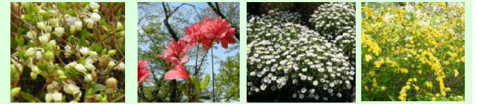
ドウダンツツジ(4月) オオムラサキ(4月) マーガレット(5月) ヤマブキ(5月)