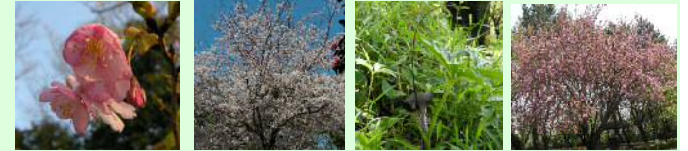
カワヅザクラ(3月) ソメイヨシノ(3月) ウラシマソウ(4月) ヤエザクラ(4月)