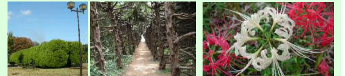
カイツカイブキのトンネル