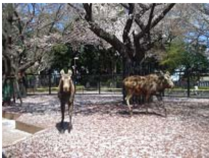
桜の下のヘラジカたち