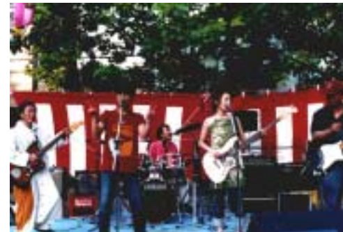
迦併舎オールスターズ仲間たち