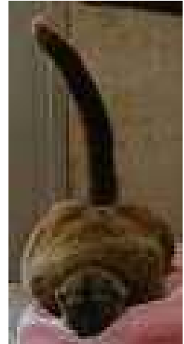
こしあん冬毛(左)と夏毛(右)