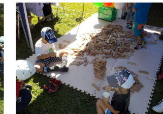
王禅寺ふるさと公園でのイベントの様子（飲食店やイベント、ワークショップなど多くの出店があった）