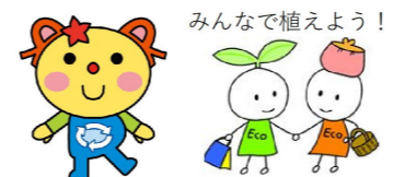
モリオンと仲良し環境局キャラクター (左：かわるん、右：エコちゃんず)