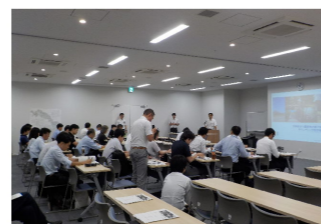
サウンディング調査の様子（左：説明会、右：現地見学会）