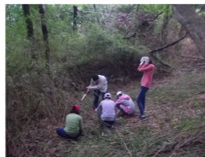
東京農業大学による環境学習