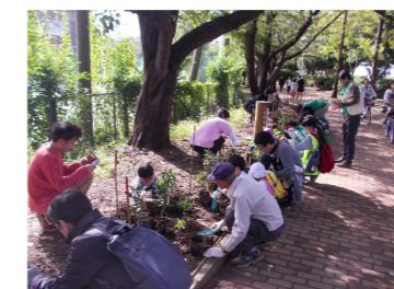
令和元年度植樹祭の様子（中原平和公園）