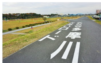
かわさき多摩川ふれあいロード