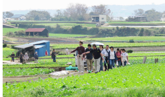
ウォーキングラリーの様子 「秋の実りと大パノラマを求めて 三浦海岸と武山を歩く」