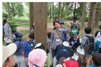
こども黄緑クラブ (セミから学ぼう!の回)