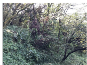
長尾2丁目特別緑地保全地区