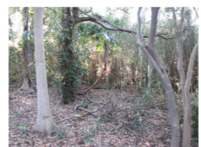
下作延西谷緑の保全地域