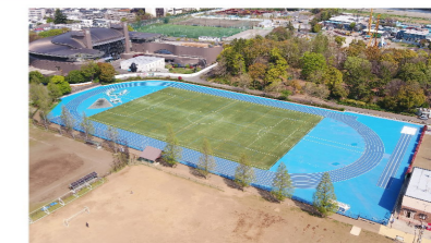
改修した補助競技場