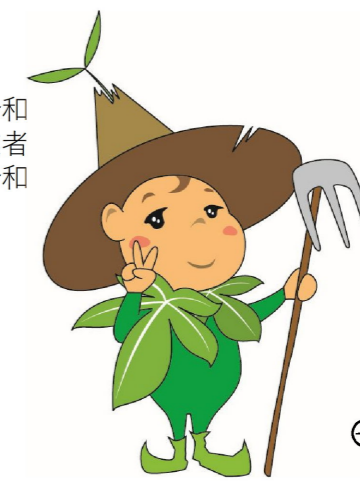
市民植樹運動イメージキャラクター「モリオン」