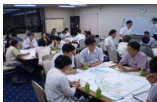
エポックなかはら