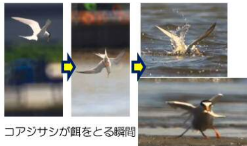
コアシサシが餌をとる瞬間

多摩川では、5月の調査時に沢山のコアシサシを見ることができます。空中でホバリング(空中で同じ位置に留まるように羽ばたくこと)を行い、小魚などを見つけると勢よく、そして迷うことなく水中へ急降下し、捕食します。初めてこの行動を間近で見た時は、干潟の底に頭をぶつけないかヒヤヒヤしました。人がいても構わず近距離で捕食シーンを見せてくれます。ぜひ、コアシサシの垂直落下捕食シーンを観察してみたいかでしょうか。