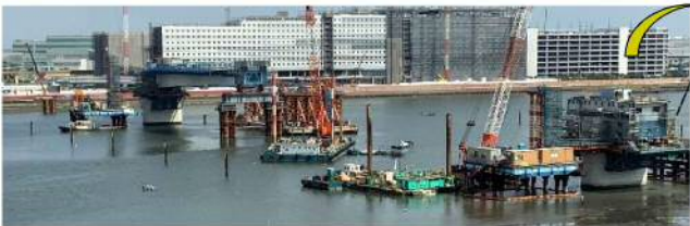
第1回台船架設（③ブロック R1.9.30）