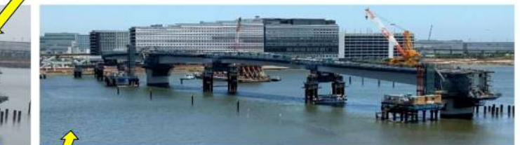
第4回台船架設（東京側⑥ブロック R2.6.10）