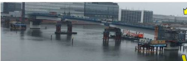
第3回台船架設（⑤ブロック R2.5.6）