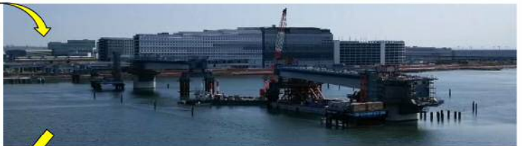
第2回台船架設（④ブロック R2.4.11）