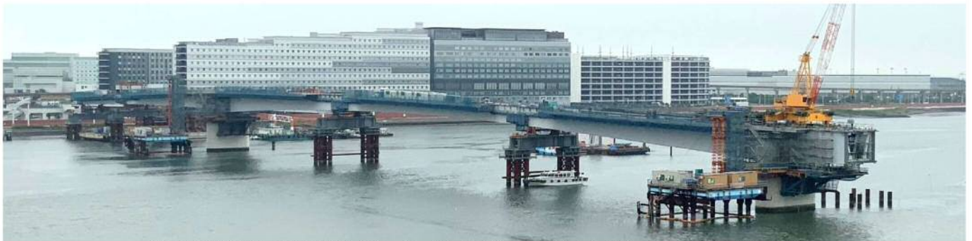
第5回台船架設（東京側⑦ブロック R2.7.21）（ライフインノベーションセンターより）

7月21日に東京側⑦の台船一括架設が無事に完了し、5か所すべての台船架設が完了しました。これにより、多摩川を渡る約600mの橋桁のうち、約370mが架設されたこととなります。昨年9月30日に③の台船一括架設を行った後、「令和元年東日本台風」により河川内に大量の土砂が堆積したため、橋桁の架設を中断せざるを得ない状況でしたが、4月11日に再開し、4か月間で4か所（④・⑤・東京側⑥・東京側⑦）の台船架設を行いました。ようやく橋の形が見えてきましたが、今後は、川崎側⑥、⑧の張出し架設および川崎側⑦の送出し架設を進めていきます。