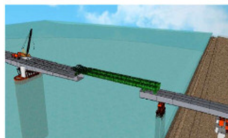
図1 送出し架設工法イメージ図

2020年12月17日から3回目の送出しを開始し、今月末に張出し架設部と締結して主桁の架設が完了する予定です。