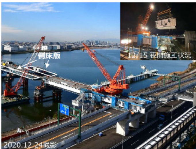
羽田側⑧張出し架設完了全景

今後、歩道・自転車道となる側床版の架設を進めるとともに、川崎側⑩の2径間鋼桁橋部、橋面整備、取付道路の整備を進めていきます。開通に向けて各所でいろいろな工事を行います。令和3年度内の一日も早い開通を目指して安全第一で工事を進めていきます。