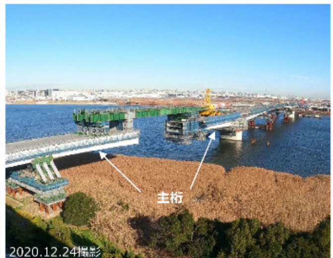
川崎側⑩送出し架設状況