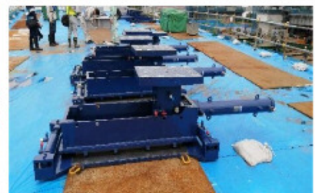
写真1 使用する水平ジャッキ