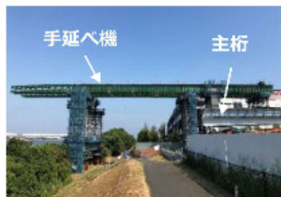
図2 手延べ機と送出し主桁