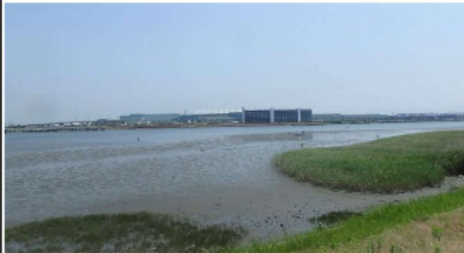
浚渫前の干潟の状況 (2018.3)

2018年4月よりP3橋脚構築のため、周辺を鋼矢板で囲み、浚渫を行いました。 その後、橋脚の基礎となる鋼管矢板の打設、橋脚の構築、橋桁の架設を行い、2021年3月にP3橋脚に設置していた斜べント（桁を架設するための仮設備）の撤去が完了しました。 これによりP3橋脚周辺の工事が完了しましたので、4月末より鋼矢板の引き抜きを行い、干潟部の埋戻しをして干潟の復元・回復を図ります。令和元年東日本台風の影響により周辺の干潟形状が変わりましたが、有識者の先生方の助言に基づき、現況の多摩川河口干潟に即した埋戻しを行います。 夏の干潮時には橋脚周りに干潟が現れる予定です。