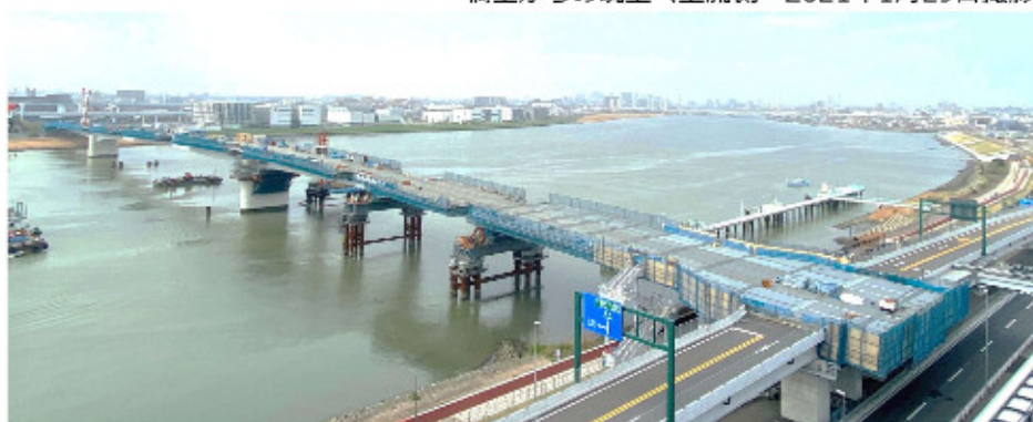
渡河部施工状況 (2021年3月30日撮影)