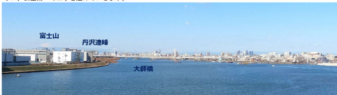
橋上からの眺望 (上流側 2021年1月29日撮影)

今回は橋上からの眺望を紹介します。上流側には産業道路の大師橋があり、その後方には丹沢連峰が望め、冬の空気が澄んだ時には富士山の冠雪を見ることができます。下流側は羽田空港D滑走とアクアラインの風の塔が望め、空気が澄んだ時には房総半島を見ることができます。皆様に橋上からの360°の眺望が楽しんでいただけるように、安全第一で工事を進めていきます。