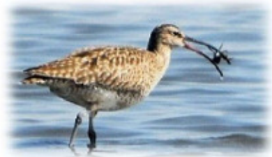
曲がったことは嫌い。って、言われると困ります…

チュウシャクシギは、殿町の干潟で見られるシギの仲間では比較的大柄(体長42cm、翼を広げると80cm)です。細くて長くて、少し曲がった嘴を持っていて、干潟では主に穴の中に嘴を差し込んでカニを捕って食べているので、右の写真のような光景をよく見かけます。見るからに差し込みやすそうな嘴で、少し曲っているくらいが丁度いいみたいですね。ただ、もっと上流の淡水域に来ることもあり、そこではカエルやオタマジャクシを食べているのですが、曲った嘴は逆効果では?と心配になります。やはり、チュウシャクシギは干潟の方が、安心して見ていられますね。