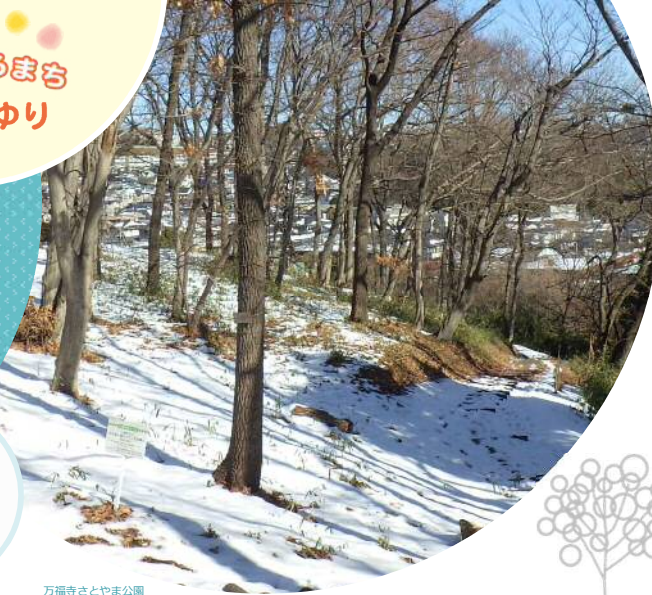
万福寺さとやま公園