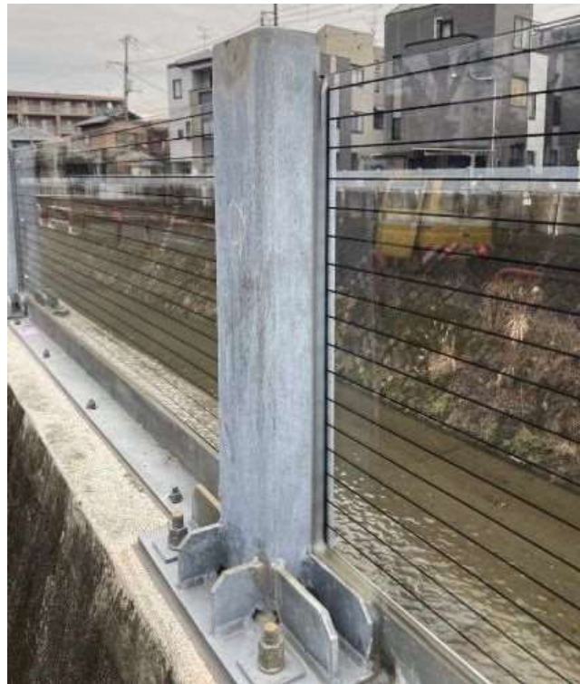
アクリル板の補修