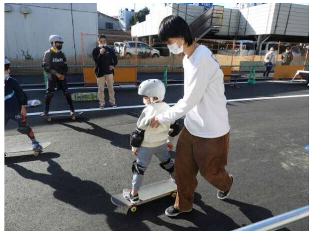
スケートボード体験会（イメージ）