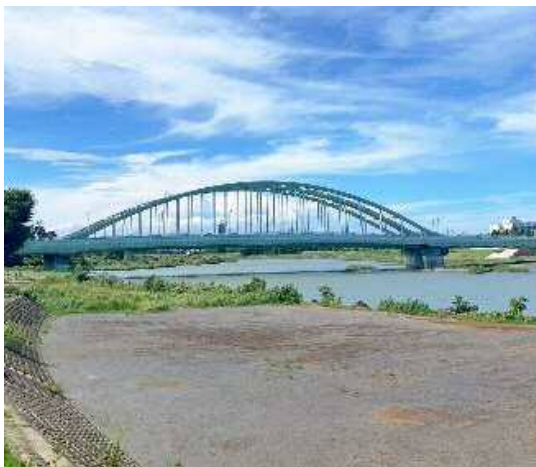
多摩川河川敷（登戸地区広場）

川崎市と小田急電鉄は本年3月「小田急沿線川崎エリアまちづくりビジョン」を公表しており、今後も引き続き、魅力あるにぎわい空間の創出等に向け連携して取組を進めて参ります。