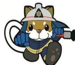
川崎市消防局 イメージキャラクター 太助