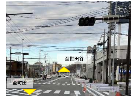
令和5年度 先行整備