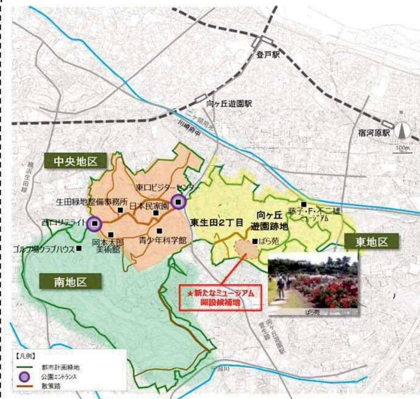
■開設候補地位置図

※ 位置図中の楕円の点線は、開設候補地のおおよその位置を示したものであり、詳細な範囲は今後検討する。