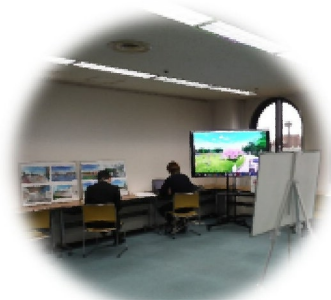
パネル展示のイメージ