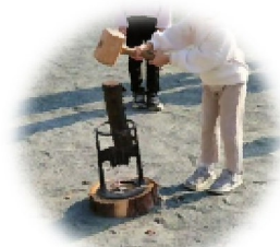
薪割体験のイメージ