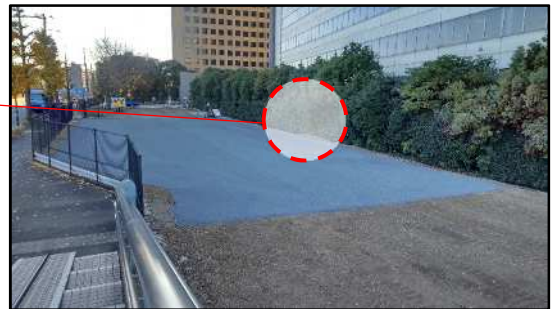
バスケットゴール設置箇所