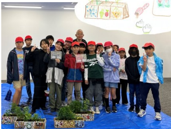
プランターを飾ってくれる日比谷花壇さんに参加頂きました！