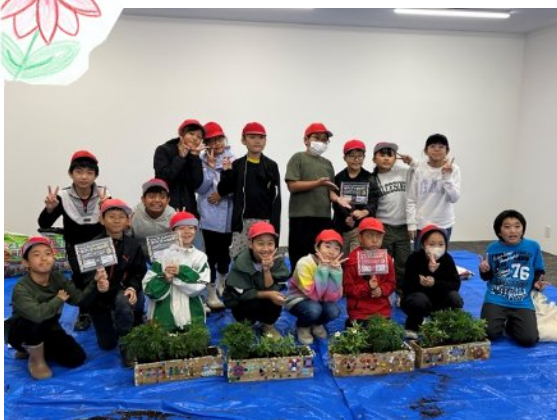
飾ってくれる企業さんにも興味津々！