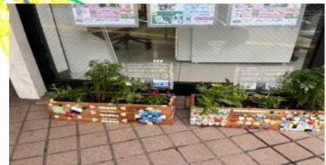
5 エイブル向ヶ丘遊園店