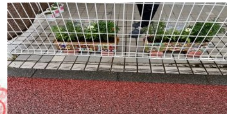
9 ういず向ヶ丘遊園保育園