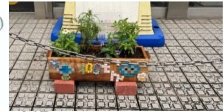
1 三菱UFJ銀行 登戸支店