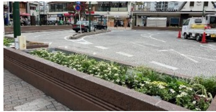
0 向ヶ丘遊園駅南口