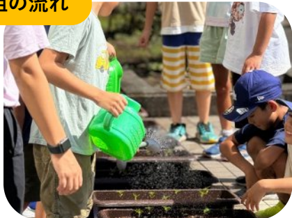
子どもたちが育てた花苗！