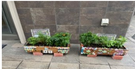
2 NPO法人療育ねっとわーく CafePOP!