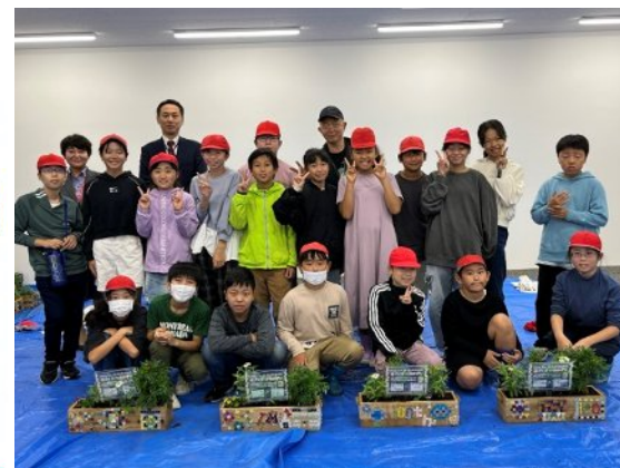
プランターを飾ってくれる三菱JF銀行さんに参加頂きました！

私はこの活動を通して自然が 好きになりました。 先生から花を大切に扱って いて私も真ねをしら花を 大切にすることができ ました。 これからも自然を大切に しようと思いました。