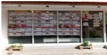
6 ミニミニ向ヶ丘遊園店