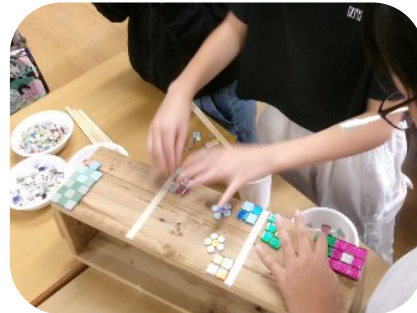
プランターを手づくり