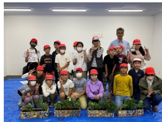
校長先生も駆けつけて下さいました！