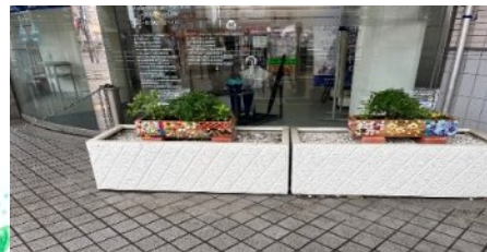
7 みずほ銀行 向ヶ丘支店