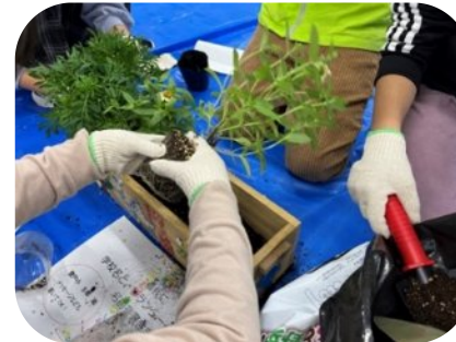
プランターに植えて