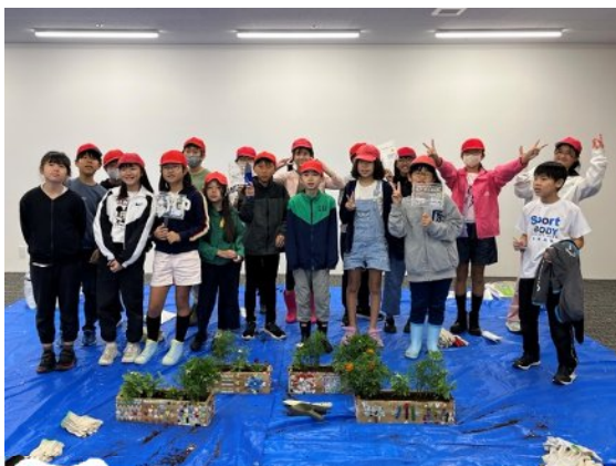
みんな雨の中、傘をさして来てくれました！