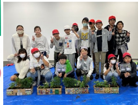
みんなで育てたジニアがきれいに咲きますように！