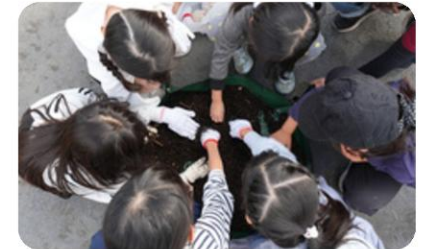
たい肥を触ってみよう！

コンポストでつくったたい肥を公園の花壇で活用し、公園の資源と家庭の暮らしをつなぐ「循環の仕組み」を育てていくこと。そして、誰もが気軽に関われる場をひらきながら、公園に関わる人を地域の中で少しずつ増やしていくことを目指しています。