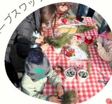
ハーブスワッグづくり