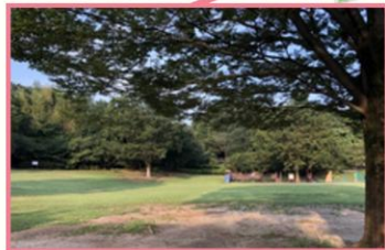
王禅寺ふるさと公園

森林や植物園など特殊な利用に供される公園です。①風致公園、②植物公園、③広場公園、④墓園などがあります。