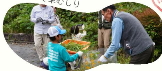
みんなで草むしり