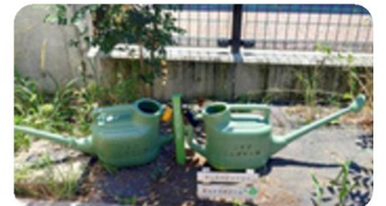
公園に設置された「じょうろ」

花植イベントやコンポスト講座をきっかけに、地域住民や公園利用者が気軽に関われる場としてスタートし、花壇の手入れやたい肥の持ち込み、たい肥の相談会など、誰でも自由に参加できるかたちで継続しているプログラムです。