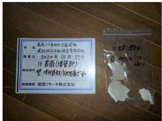
【黑板誤記】書斎(増築部) → 倉庫(増築部)