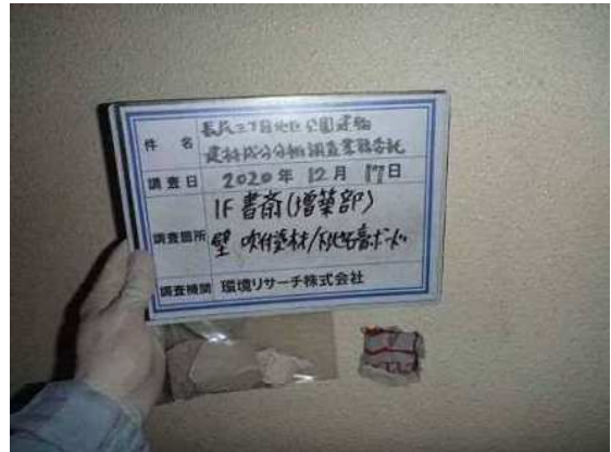
【黑板誤記】書斎(増築部) → 倉庫(増築部)