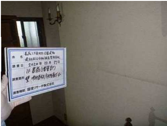
【黑板誤記】書斎(増築部) → 倉庫(増築部)