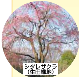
シダレザクラ (生田緑地)