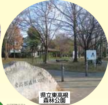
県立東高根森林公園