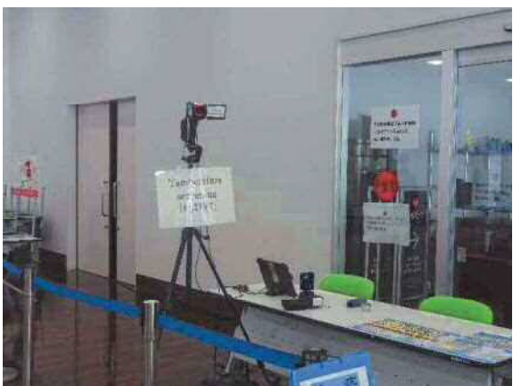
固定式サーモグラフィー