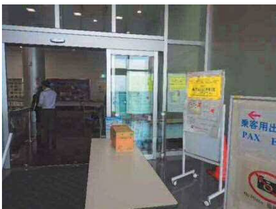
2階検疫所入口 (全景)