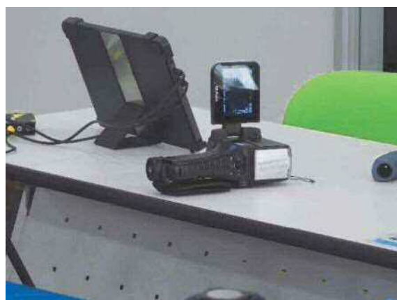
ハンディ式サーモグラフィー