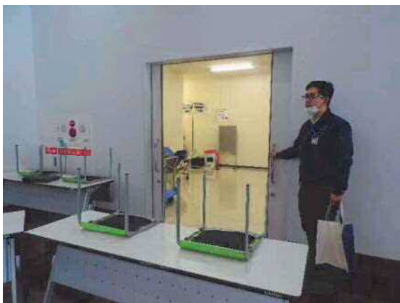
患者待機場所入口