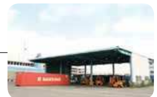
全天候型検査場 All-weather inspection Areas