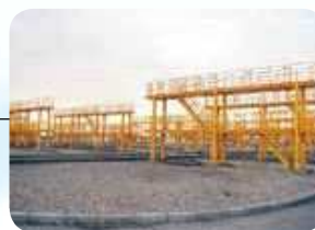
リーファー電源 Power points for a refrigerated container