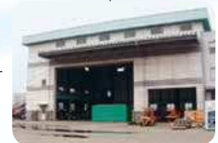
メンテナンスショップ Maintenance-Shop