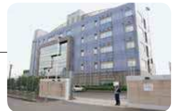
ターミナル入口 管理棟 Terminal entrance and office building