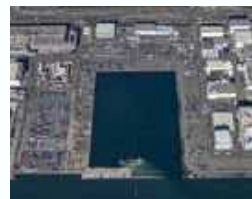
東扇島掘込部 (R4年12月撮影) Excavated part of Higashi-Ogishima (Photo taken in Dec, 2022) 东扇岛掘込部 (摄于2022年12月)