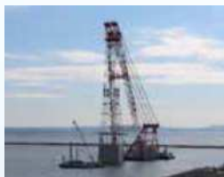
ケーソン据付工事 Caisson installation work 沉箱的安装施工

东扇岛掘込部将建设泥土作为填埋用材料使用，通过海面填埋进行土地建造。填埋之前从2018年度开始进行了必要的护岸构筑。