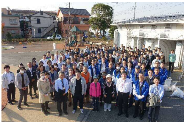
キングスカイフロントからの参加者