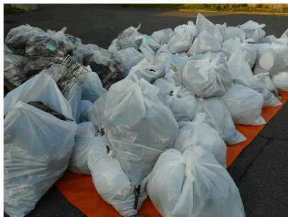
収集したごみ（殿町夜光線）