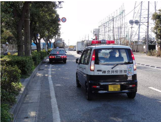
路上駐車車両への注意喚起の様子 (川崎臨港警察署)