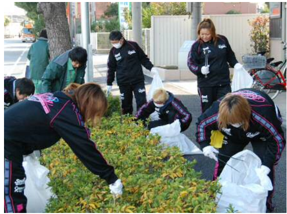
小島新田駅周辺の清掃の様子 (ワールド女子プロレス・ディアナの皆さん)