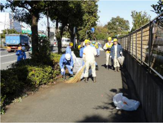
夜光交差点周辺の清掃の様子