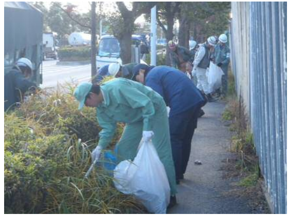
入江崎水処理センター周辺の清掃の様子