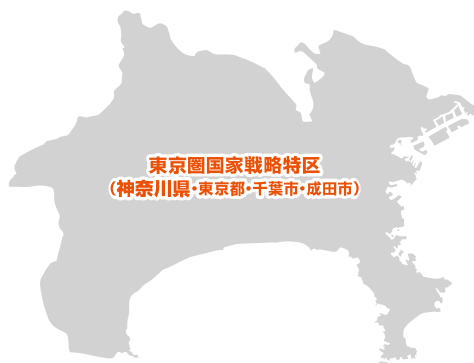
東京圏国家戦略特区 (神奈川県・東京都・千葉市・成田市)

大胆な規制改革等を通して経済社会の構造改革を重点的に推進することにより、産業の国際競争力の強化とともに、国際的な経済活動拠点の形成を図り、国民経済の発展と国民生活の向上に寄与することを目的としています。 ※平成26年5月指定