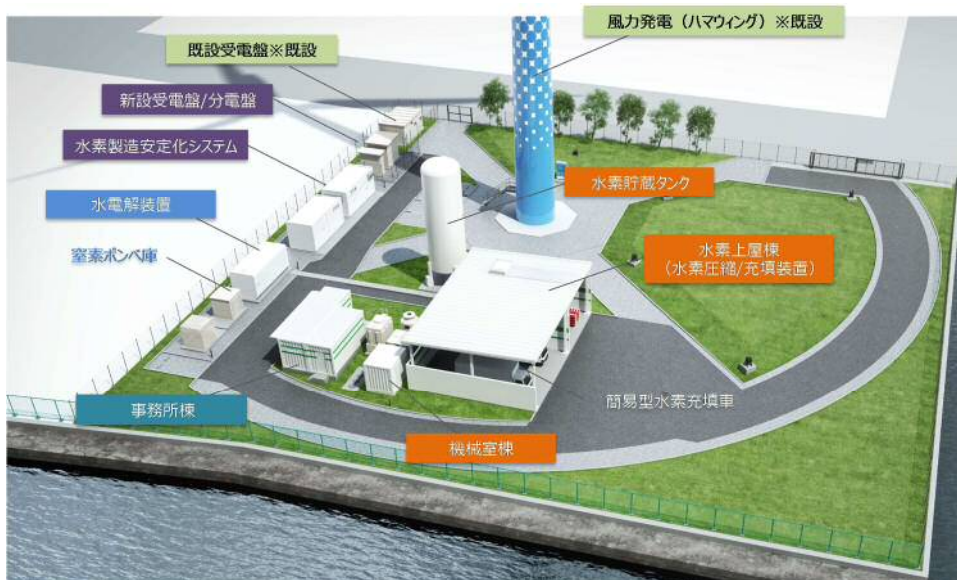
ハマウイング敷地内計画イメージ（日本環境技研㈱）