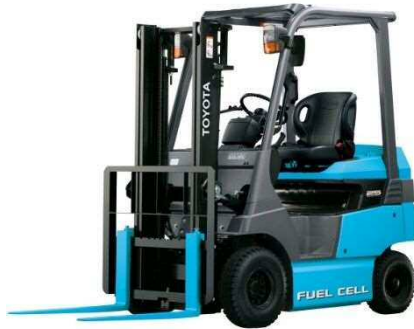
燃料電池フォークリフト (株)豊田自動織機