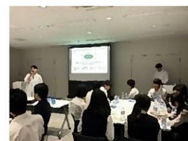
(日本薬理評価機構による実験体験)