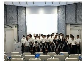
(ペプチドリーム講演後の1枚)