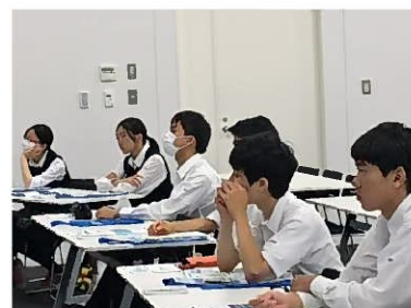
(川崎総合科学高等学校による見学会の昨年の様子)