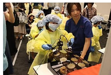
(キングスカイフロント夏の科学イベントの昨年の様子)