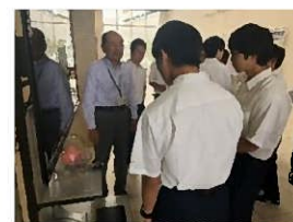
(ナノ医療イノベーションセンターの見学)

*Peptide Discovery Platform System、独自の創薬開発プラットフォームシステム