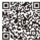
防災情報ポータルサイト 携帯用QRコード