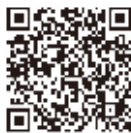
川崎市防災気象情報 ポータルサイト 携帯用QRコード