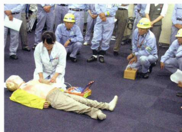
<写真6> 救護訓練(AED使用)