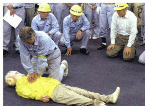
<写真4> 救護訓練(心臓蘇生)