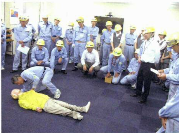
<写真3> 救護訓練(心臓蘇生)