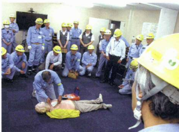
<写真5> 救護訓練(AED使用)