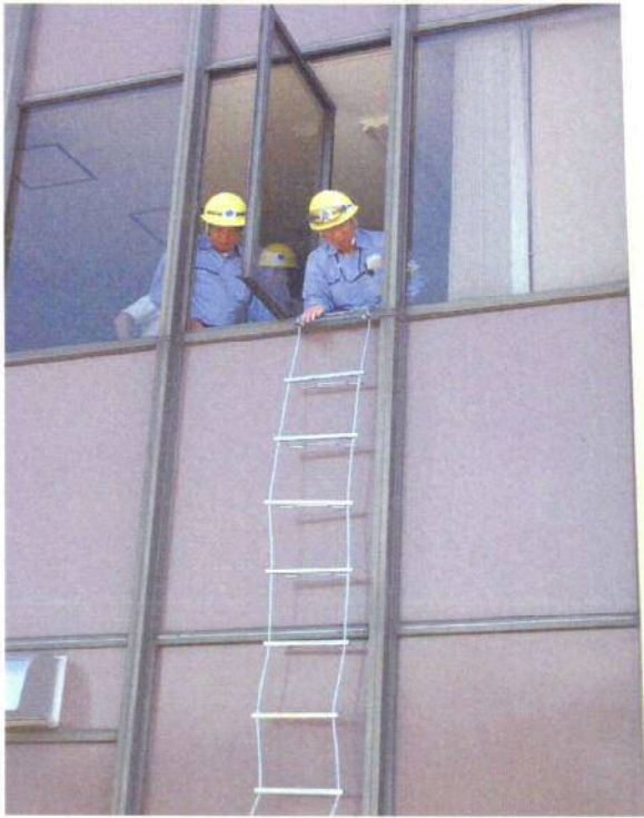
<写真7> 避難訓練(避難はしご)