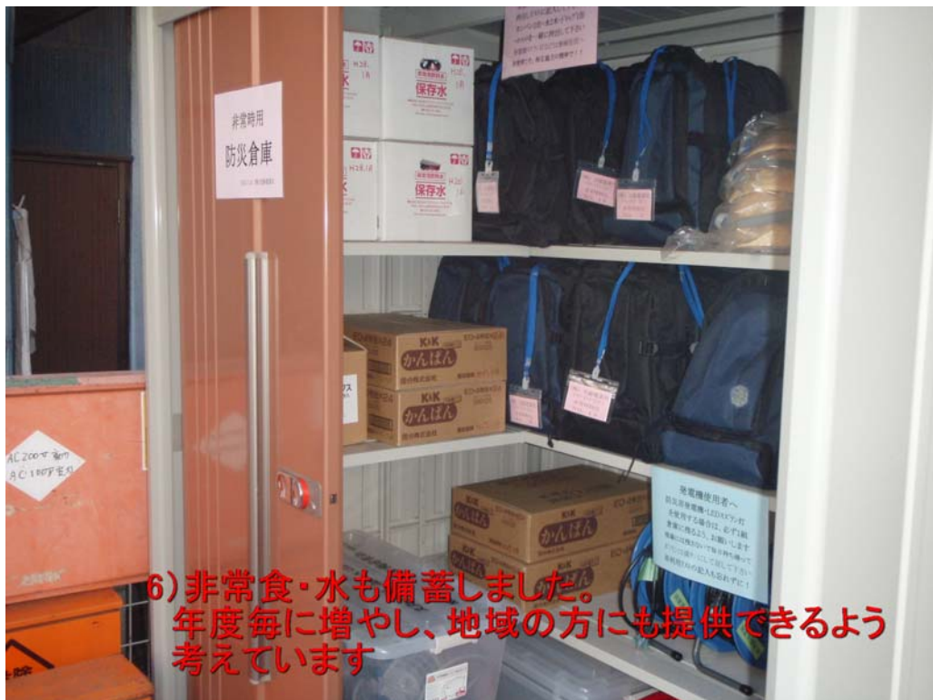
(5. 社員緊急帰宅時持出セット)

6) 非常食・水も備蓄しました。 年度毎に増やし、地域の方にも提供できるよう 考えています